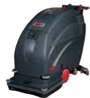
FANG24T / 26T / 28T