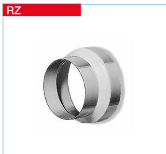
■ Reduzierungen aus verzinktem Stahlblech bzw. Kunststoff*.