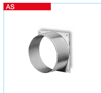
■ Anschluss-Stutzen AS Mit quadratischer Flanschplatte (102 x 102 mm) und rundem Stutzen (50 mm lang), aus Kunststoff. Zum Aufsetzen von Rohren (ND 100) auf plane Flächen.