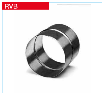
■ Rohrverbinder aus Stahlblech, verzinkt.