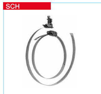
■ Schlauchschellen Metallband mit Spannschloss. Lieferung als Verpackungseinheit mit jeweils 10 Stück.