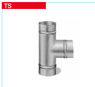
■ T-Stücke aus Stahlblech, verzinkt.